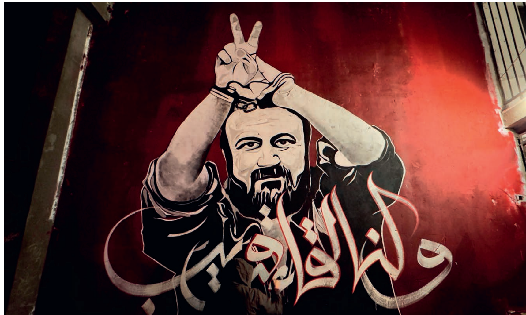
Muurschildering van Marwan Barghouti, de potentiële nieuwe leider van de Palestijnen.