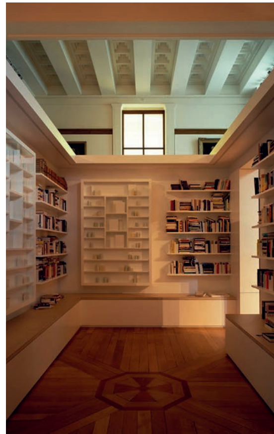
De Library of Exile.

In 2019 bedacht De Waal de installatie Library of Exile die op de Biënnale van Venetië furore maakte: meer dan tweeduizend titels van zo'n vijftienhonderd schrijvers en dichters uit 58 landen die hun werk in exil hebben moeten schrijven dan wel exil als onderwerp hebben. Venetië, waar De Waal vaak het getto bezocht, staat voor hem symbool voor exil. In 1516 werden alle joodse bewoners hun huis uitgezet en verplicht te verhuizen naar het stadsdeel Cannaregio. De joden konden hun getto slechts verlaten via twee poorten, die 's nachts op slot gingen. Niet-joodse Venetianen moesten zich van de overheid 'veilig voelen en niet geïnfecteerd worden door joodse ziekten' legt De Waal uit in de Library of Exile -catalogus van het British Museum.