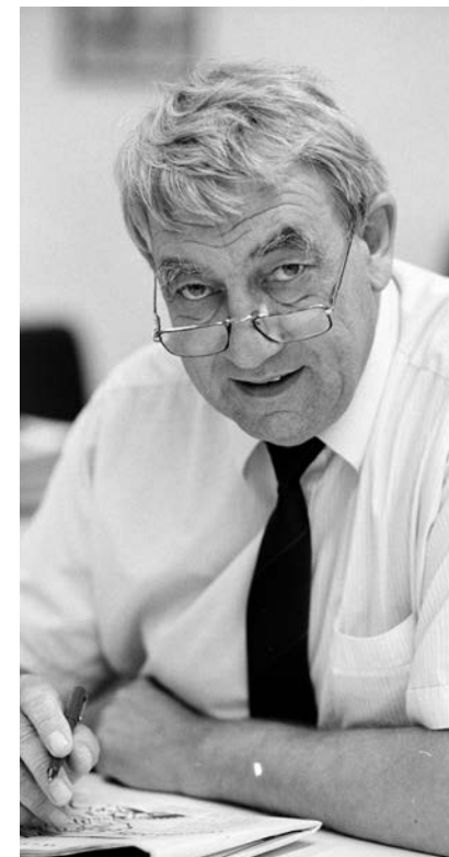
Frans Nypels FOTO N.H.-ARCHIEF

In de jaren tachtig doken steeds weer verhalen op over het miljardvermogen van de Oranjes. Het Amerikaanse blad Fortune noemde Beatrix in oktober 1987 een van de rijkste vrouwen ter aarde, met een vermogen van 4,4 miljard dollar. “Totale onzin,” was de verbolgen reactie van RVD-hoofddirecteur mr. M.J.D. van der Voet. Hoeveel