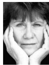
Dens Vroeghe (1939) is journalist, antiquair en auteur van een tiental romans.

Toen we terug waren in het beschermende duister van de zaal, slaakte ik een zucht van verlichting. Nooit denken dat men wel zal vergeten wat je hebt geschreven. Al was het de zuivere waarheid.