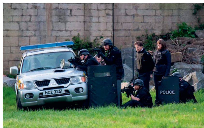
Still uit The Hunt for Raoul Moat.