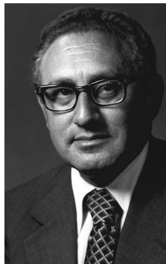
Henry A. Kissinger in 1973.