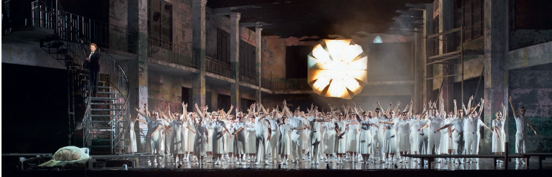
Slotscène van de Gurre-Lieder tijdens de wereldpremière van de encensering van Pierre Audi bij De Nationale Opera, 2014.