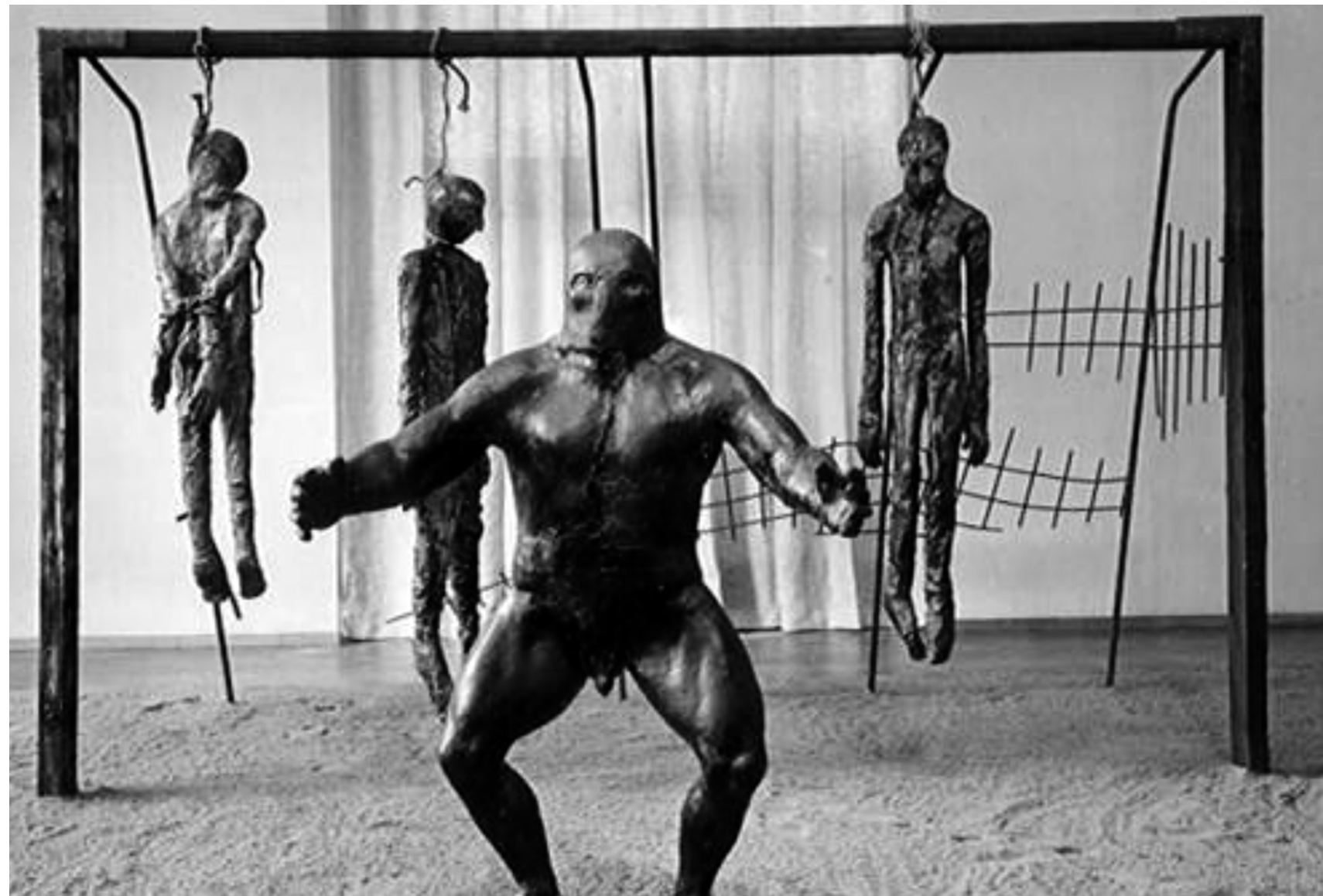
Het doel van Santiago de Chile.