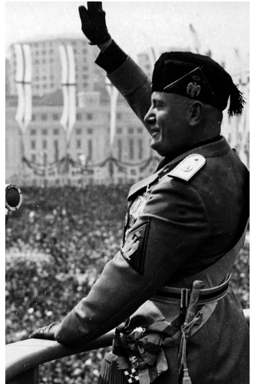
Benito Mussolini in 1935.