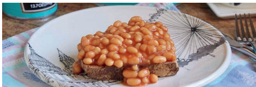
Beans on toast.

Wat eten de Britten het liefst dat ze zelden thuis klaarmaken? Dat zijn fish and chips, roastbeef