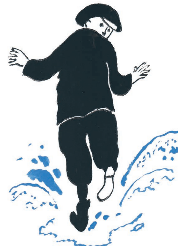
Omslagtekening van O, die jongen? Die heb ik ook gekend.