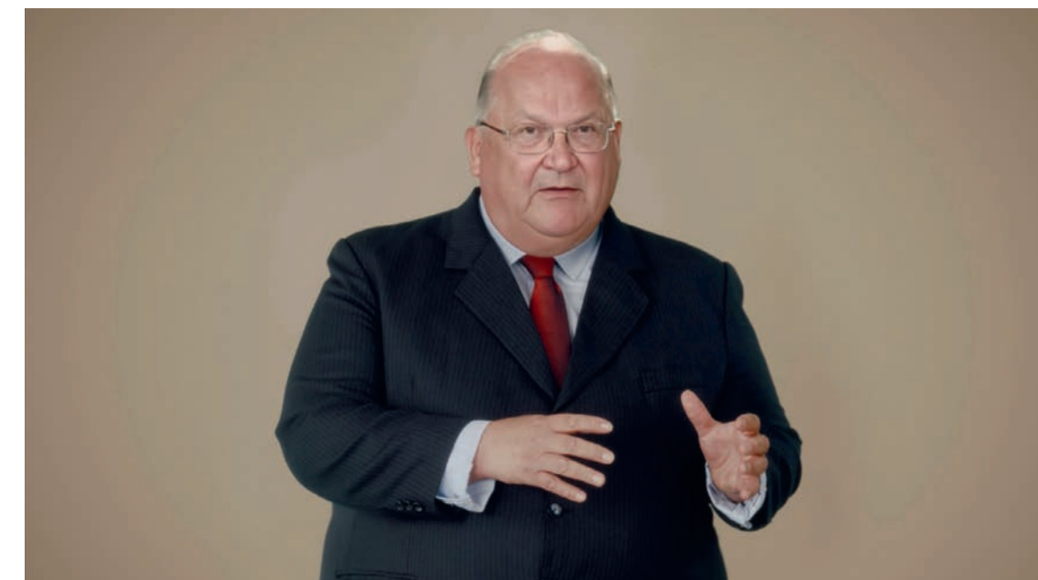
Jean-Luc Dehaene houdt een deepfake verkiezingstoespraak voor de cd&v.

Ooit voerden wij een hartelijke briefwisseling over het feit dat men toentertijd niets kon terugtrekken van de ziekenkas wanneer men zijn tanden moest laten trekken. Die kwestie is intus-